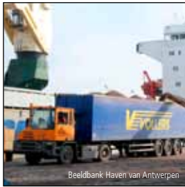
Beeldbank Haven van Antwerpen

Le chargement et le déchargement de ce poids lourd se fait au moyen d'un chariot élévateur ou d'un transpalette.